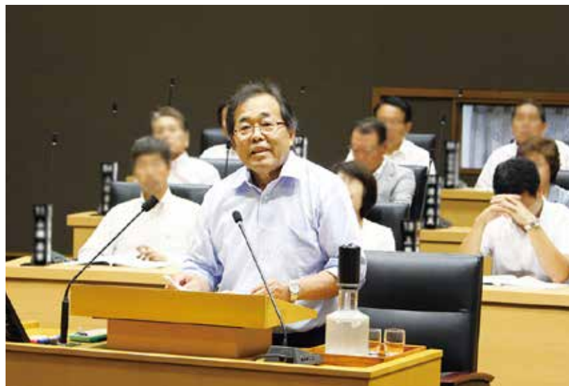
改選後初の6月議会も一般質問で登壇しました。松山定例市議会(年4回)に9年目も、全議会(33議会)連続登壇を続けています。

私の廿日市市職員への直接訪問聞き取り調査では、同職員は何年も前の話だから、はっきりとは覚えてはいないと前置きしながらも、「宮島水族館を案内する何日も前に、松山市役所から宮島水族館の視察と案内依頼の連絡があった」と答えた。また、男女二人別々の出張事前申請にも事後報告にも「宮島視察」は存在せず「広島での会議出席」しか無かった事実や、高速艇を利用したにもかかわらず宮島への旅費精算もしなかったこと、