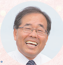
発行・梶原ときよし